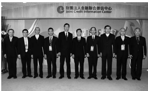
▲ 金管會陳主委裕璋與「金安獎」績優機構合影

業全球大會」這個國際性的專業頂尖會議，為提升台灣國際知名度及能見度而能有所貢獻。