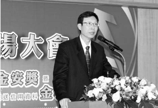
▲ 金管會陳主委裕璋於致詞表示，金管會要求聯徵中心以最高標準安控規範落實資安，而聯徵中心的努力亦值得肯定。

人員除頒發獎狀外，並致贈每位獎金新台幣五萬元，聯徵中心並出版績優機構及績優人員績優事蹟表揚名冊，以增殊榮。